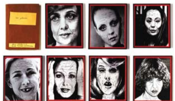
Annette Messenger SOIS BELLE ET TAIS TOI

Gianni Motti, The Victims of Guantanamo Bay (Memorial) , 2006. (détail)