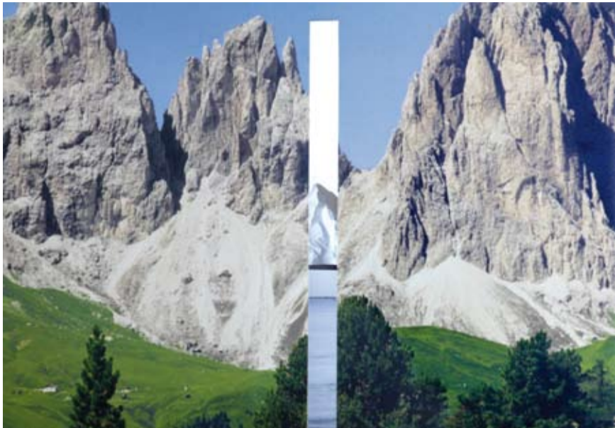
Nicolas Milhé, Meurtrière #2 , 2009.