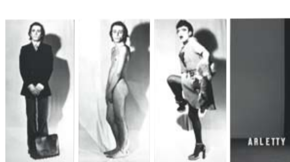
Michel Journiac SOIXANTE-HUIT'ART

Le monde de l'art n'en reste pas moins un univers flou et bouillonnant répondant à ses propres codes, objectifs et subjectifs, qui restent difficilement appréhendables pour le grand public, comme c'est le cas pour tout domaine spécialisé. Parallèlement, les « nouveaux princes », capitaines d'industrie ou grands patrons, constituent les mécènes et collectionneurs de notre époque et contribuent aussi à donner le « la ».